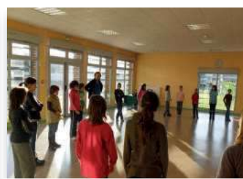
Interventions en milieu scolaire