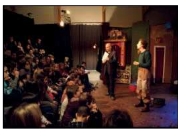
Bords de scène