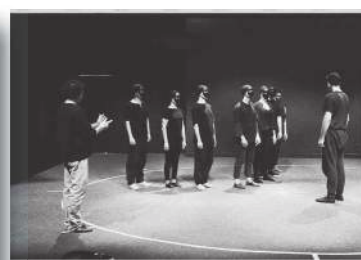
Ateliers de jeu